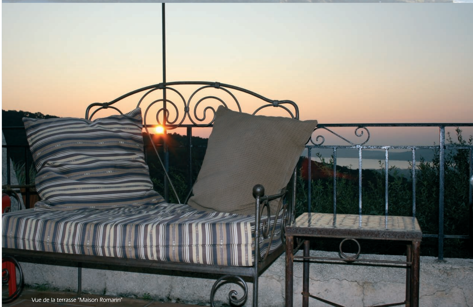
Vue de la terrasse "Maison Romarin"

Maison à louer, activités terre et mer comprises