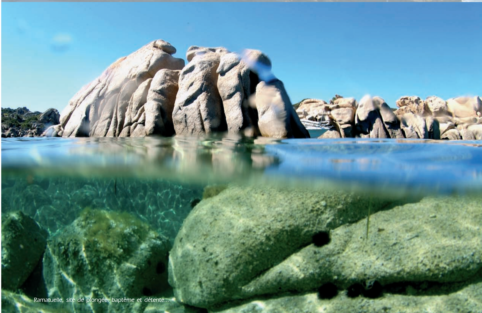
Ramatuelle, site de plongée, baptême et détente...